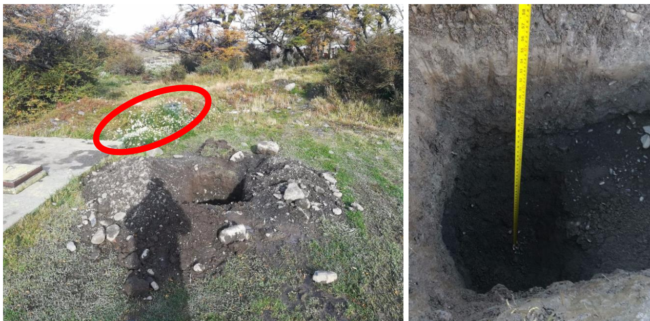
Figura 4. Izquierda: vista general de la fosa séptica N°5 mostrando la calicata, el círculo en rojo ovalado es la tubería que presento el problema de conexión con la fosa séptica N°5. Calicata de 150 cm de profundidad (si se observa la huincha de medir la parte superior indica un máximo de 58 pulgadas y fracción). Se observa que el fondo del suelo no presenta agua.

De la observación de campo se determinó que no había presencia de napa en los primeros 1.5 metros, las paredes de la calicata indicaron alto contenido de grava y arena, no se apreciaron indicios de material negro que pudiera estar asociado a la acumulación de material orgánico en descomposición, como tampoco de material oxidado que es común cuando existen fluctuaciones del nivel de napas freáticas.