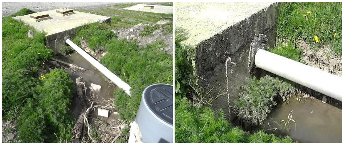
Figura 1. Izquierda: vista general de apozamiento de líquidos y derecha: Vista en detalle de zona de filtración de las aguas servidas.